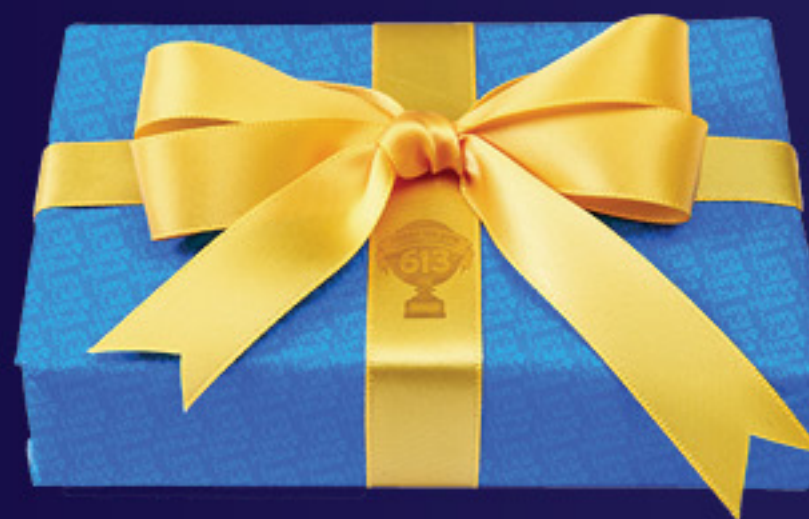
Examen Final CADEAU SURPRISE !