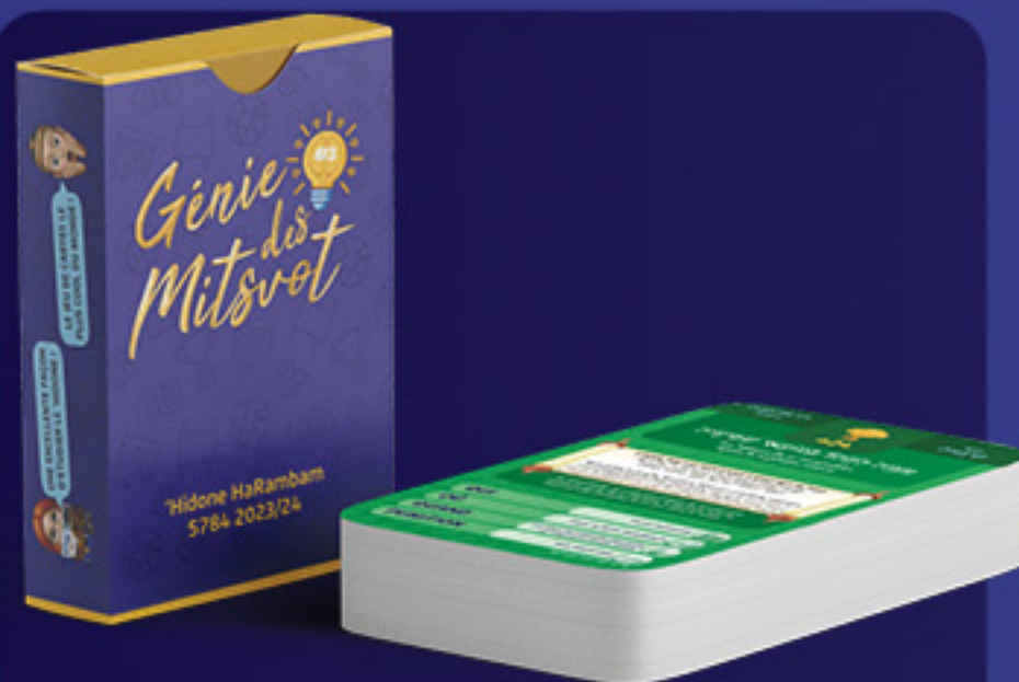
Examen 1 JEU DE CARTES

Reçois une récompense pour chaque examen que tu as réussi* !