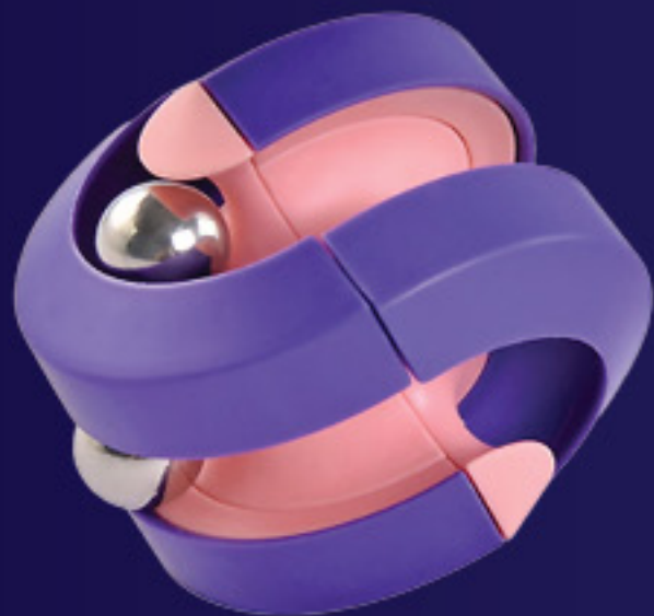
Examen 3 BOULE ORBITALE