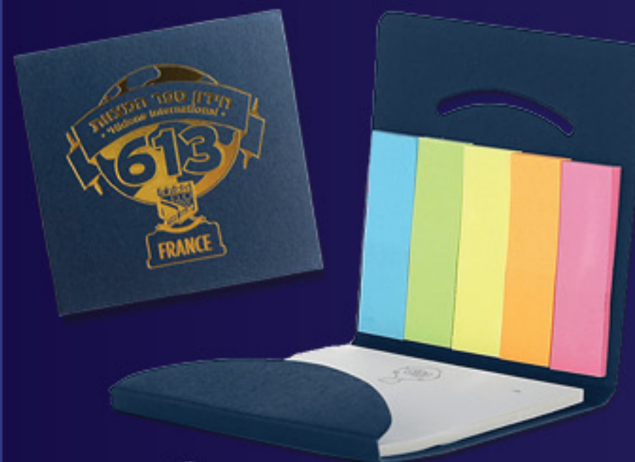
Examen 2 KIT POST-IT